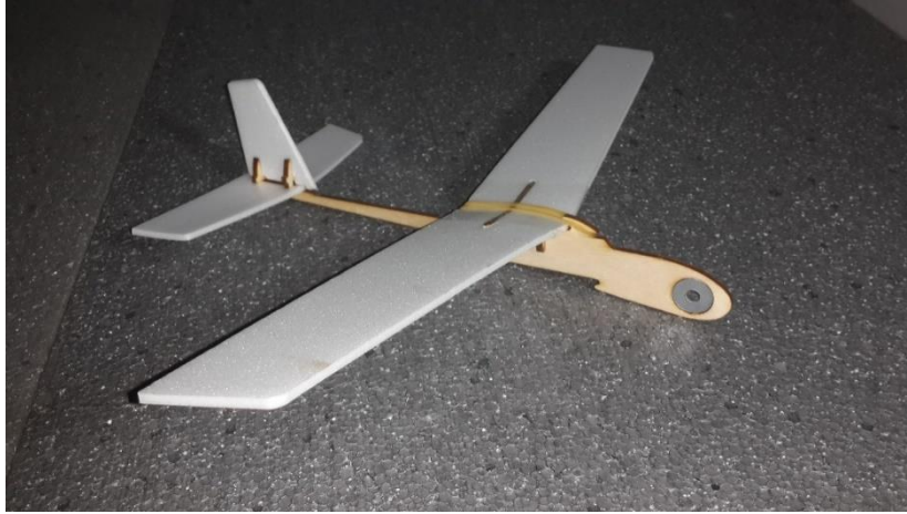
Figür – 2 Mini planör ( Yaklaşık ağırlığı 6 gr )

Takımların pilotları öğrenci ise uçuş süreleri %10 iyileştirilecektir.